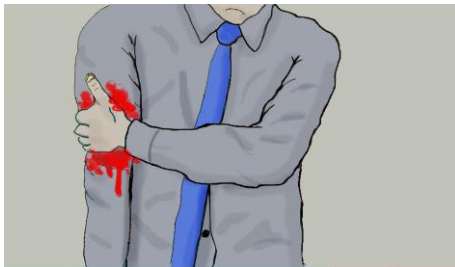
KREW TRYSKAJĄCA Z RANY