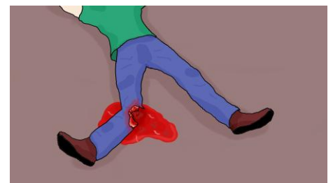
CZĘŚCIOWA LUB CAŁKOWITA AMPUTACJA KOŃCZYNY