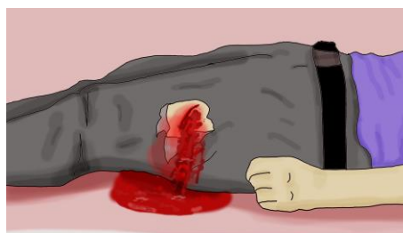
KREW ROZLEWAJĄCA SIĘ NA PODŁOŻE