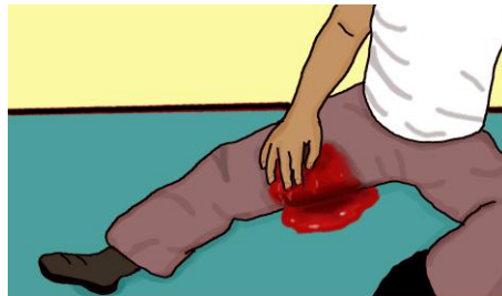
KREW WYCIEKAJĄCA Z RANY