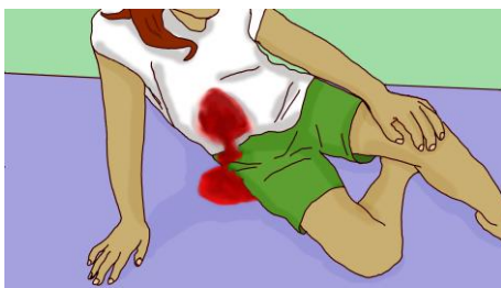
UBRANIE PRZESIAKNIĘTE KRWIĄ