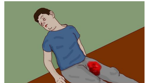
KRWOTOK U OSOBY NIEPRZYTOMNEJ LUB SPLĄTANEJ